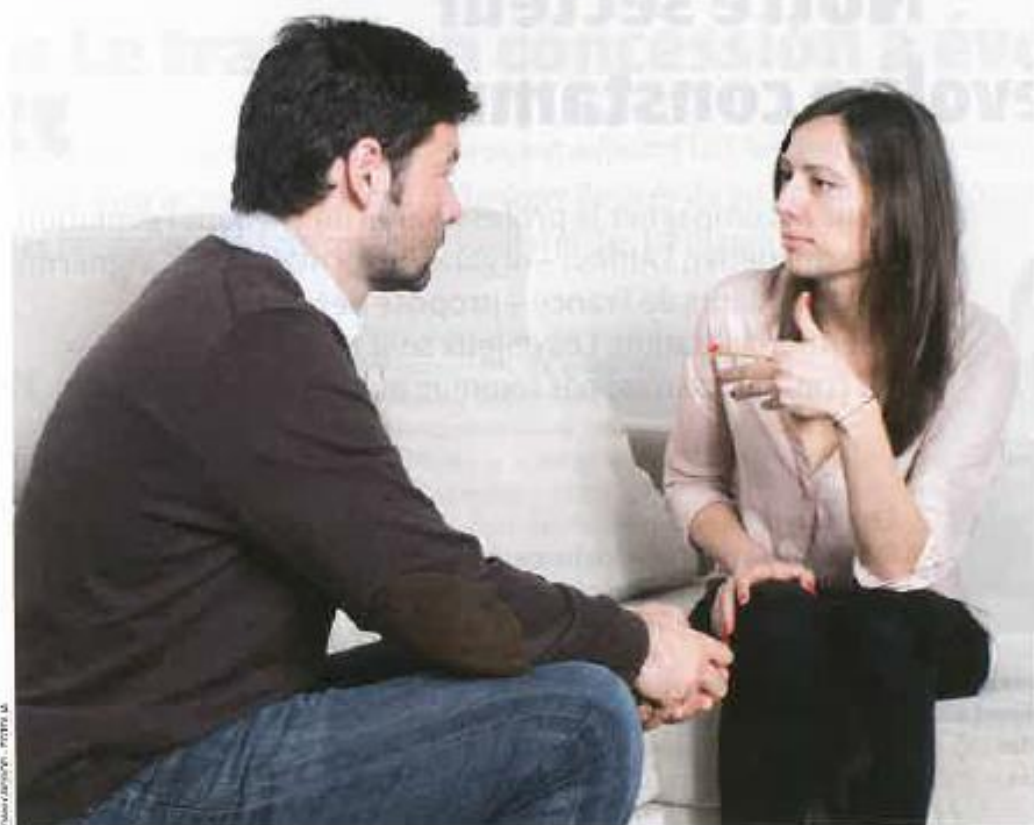
Transférance ne remplace pas les discussions avec le conseiller en bilan de compétences. Il est un outil parmi d'autres pour réaliser sa reconversion